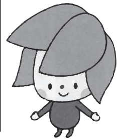
大会マスコット ゆーりん