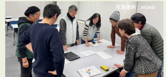
石川県庁でのJVOAD打合せ