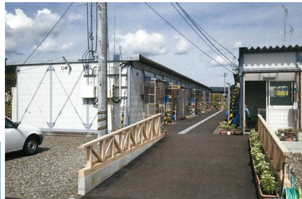
応急仮設住宅 H19.3月 能登半島地震