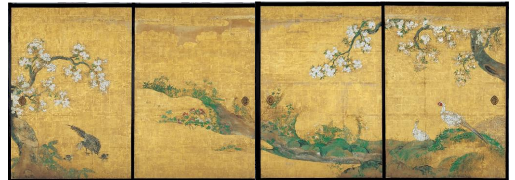
おうかきじず 重要文化財 『桜花雉子図（名古屋城本丸御殿表書院一之間障壁画）』