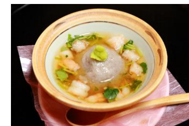
加賀れんこんのはす蒸し