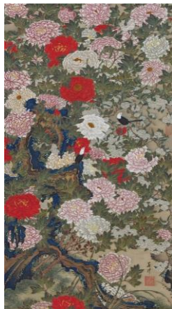
どうしょくさいえ 国宝『動植綵絵 ぼたんしょうきんず 牡丹小禽図』 伊藤若冲