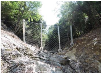
安全対策(ワイヤーネット)