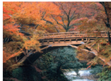
山中温泉 こおろぎ橋