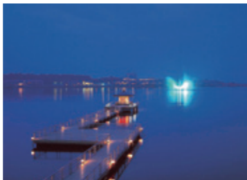
片山津温泉 浮御堂