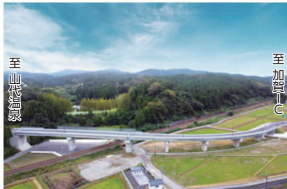
●高山跨線橋 構造形式／5径間連結非合成板桁橋 +2径間連結ポステンション方式PCバルブT桁橋 橋長／L=239.0m 幅員／W=6.5(9.5)m