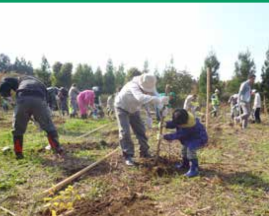
県民参加の森づくり(植林活動)