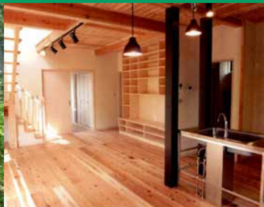
県産材を使った木造住宅