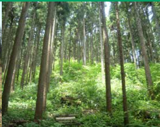
間伐後のスギ人工林