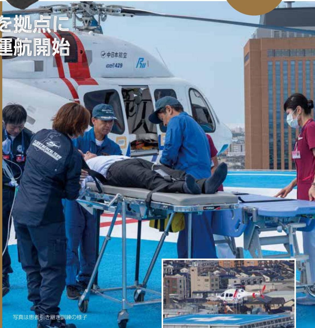
写真は患者引き継ぎ訓練の様子

県議会では今後も、県民の皆様が安全・安心に生活できる医療体制が確保されるよう、県政の課題をチェックしていきます。