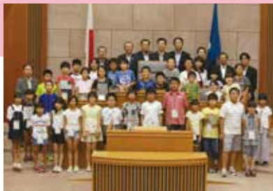
参加した子どもたちと議場で記念撮影

夏休みの恒例行事となった「ふれあい親子県議会教室」が8月21・22日に開かれ、68組の小学生と保護者が参加しました。県議会内を見て回ったり、教室に合わせて用意した特製名刺を手に議員にあいさつしたり、疑問に思っていることを直接聞いたりするなど、盛りだくさんの内容で、県議会の役割や議員の仕事などを楽しみながら学びました。