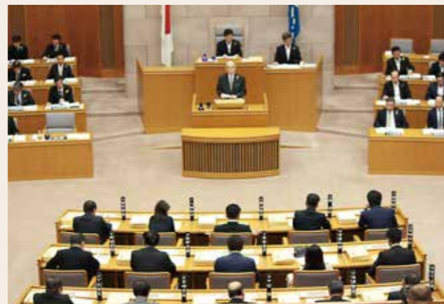
議長席は傍聴席から見て正面前方にあり、議場全体を見渡せます

議長と副議長は、議員の中から選挙で選ばれます。議長は、対外的に県議会を代表するとともに、本会議の議事を整理して、会議が円滑に運営されるように努め、議場の秩序を保ちます。また、議会のさまざまな事務を監督し、処理することも議長の仕事です。 副議長は、議長が出張や病気などで職務を行えない時などに議長の職務を担います。 県議会は、条例や予算等を議決するという重要な権限を持っており、公正な議事進行を行う議長、副議長の役割は非常に大きいと言えます。