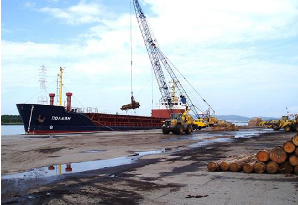
富山港・七尾港 輸入原木の集積地