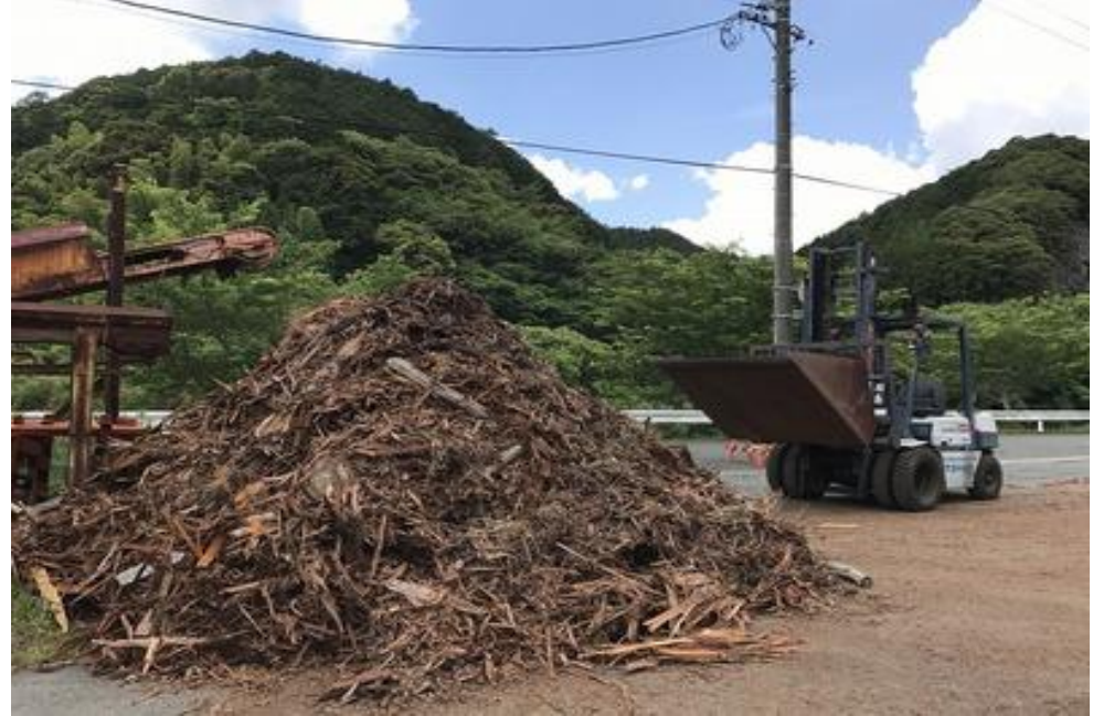
廃木皮の有効活用