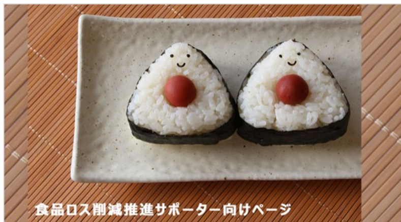
食品ロス削減推進サポーター向けページ