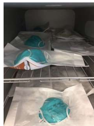
図 2：ロード用の N95 マスクの包装と棚への積載例