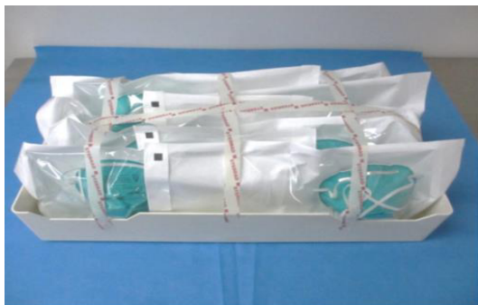
図 1：ロード用の N95 マスクの包装とトレイへの積載例