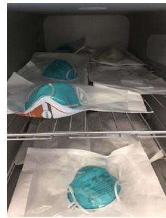
図 2：ロード用の N95 マスクの包装と棚への積載例