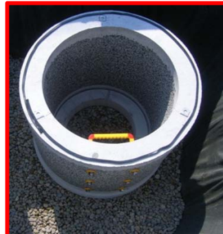
雨水浸透施設の整備(金沢市)