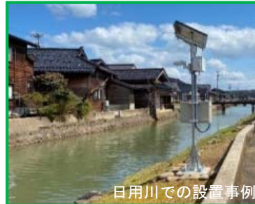
日用川での設置事例