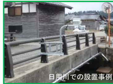
日用川での設置事例