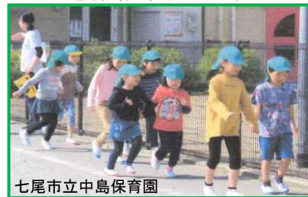
七尾市立中島保育園