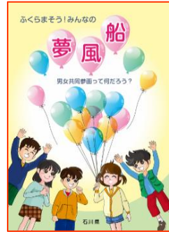
←小学生向け漫画形式の副読本