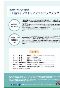
←中高生向けライフキャリアのデータブックとすごろく