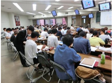
←大学での出前講座