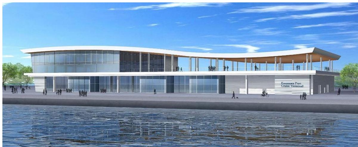
③施設整備イメージ