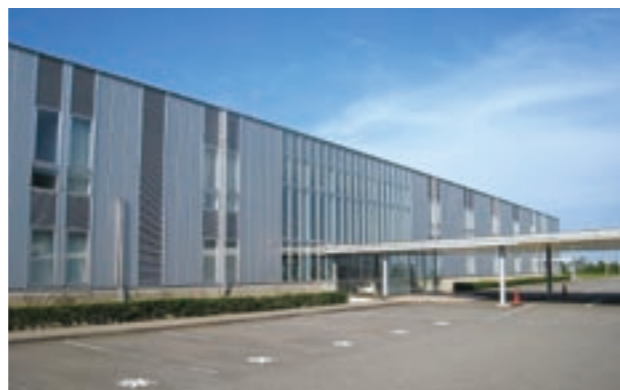
いしかわクリエイトラボ(いしかわサイエンスパーク内)