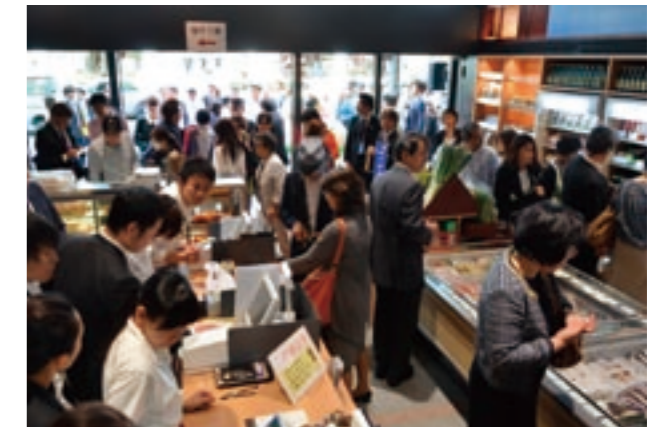
首都圏アンテナショップ