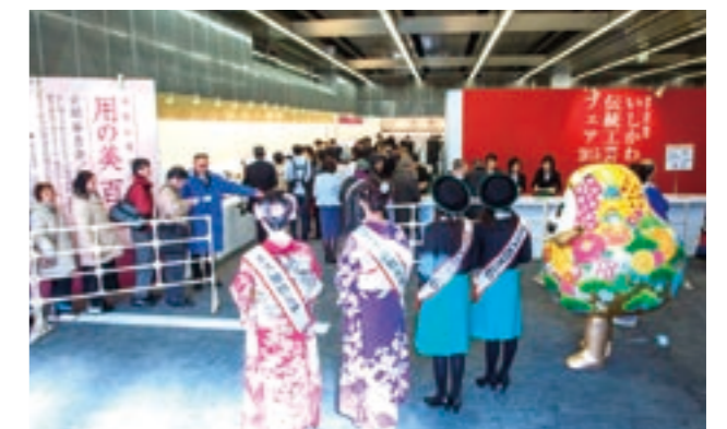
いしかわ伝統工芸フェア