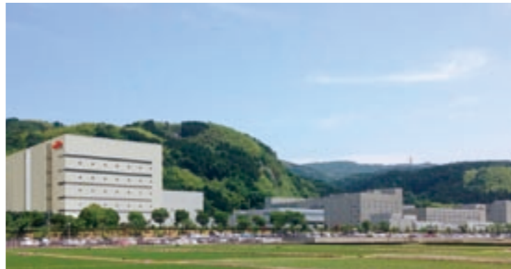
誘致企業のさらなる拠点化の推進