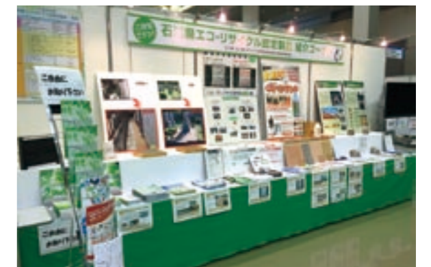
エコ・リサイクル認定製品