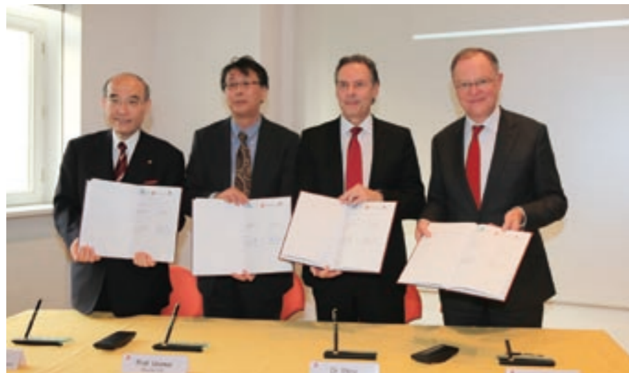
ドイツCFKバレーとの連携協定締結