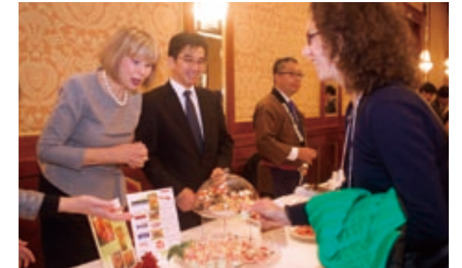
海外販路開拓商談会