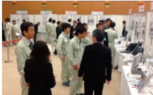
大手メーカーとの技術提案型展示商談会

② 新たな需要の創出に向け、異業種間の連携や新分野展開を支援するとともにベンチャー企業の創出・育成等を推進します。