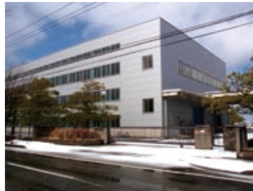
研究開発部門等の本社機能の誘致