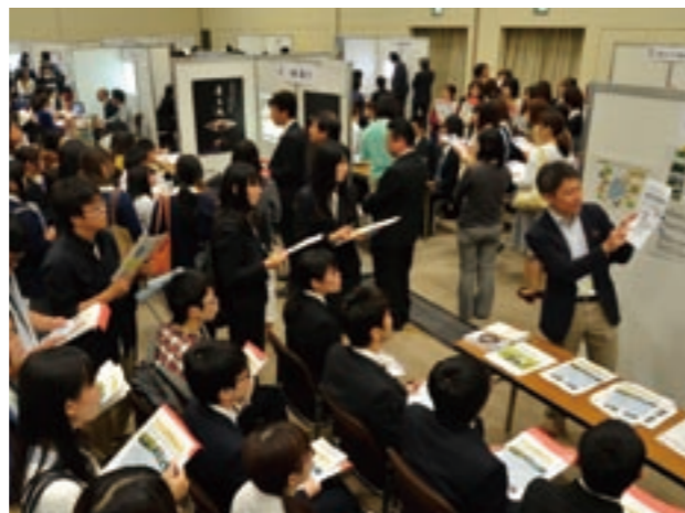
インターンシップマッチング交流会