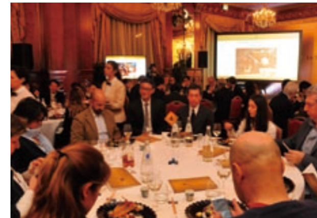
食文化の総合力発信(食文化提案会)