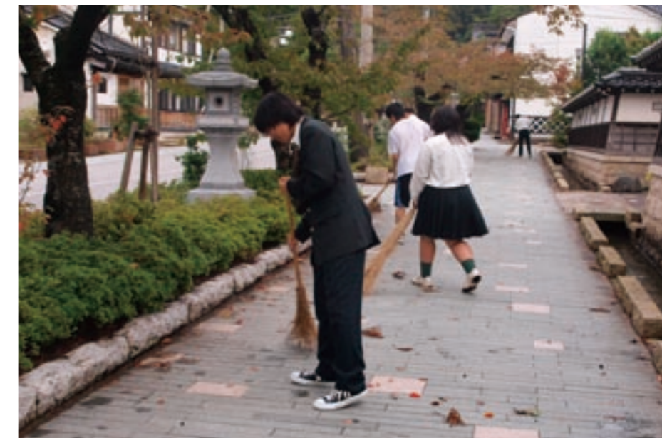
高校生のボランティア活動