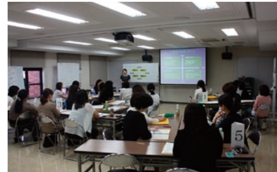
女性センターにおける管理職養成研修