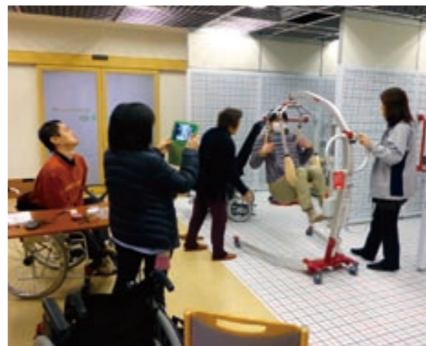
リハビリテーションセンター