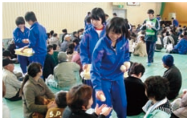
地域と学校が連携した避難訓練