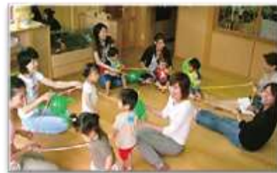
子育てしやすい環境