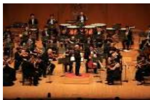
オーケストラ・アンサンブル金沢