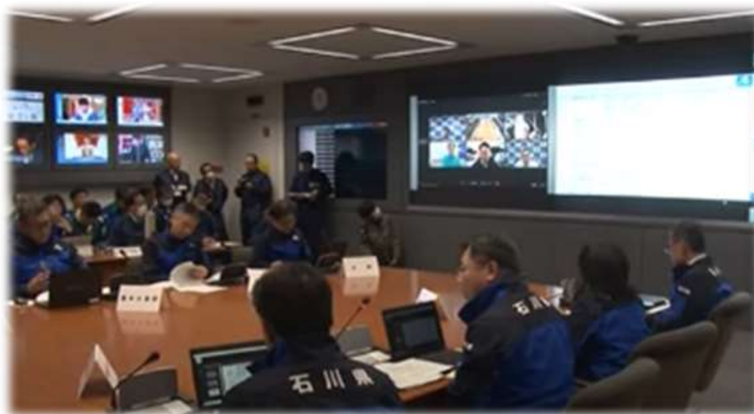
石川県災害対策本部員会議

また、今回の教訓を踏まえ、被災者への対応、避難所での環境整備、孤立が発生した場合への備えなどについても充実させるほか、 デジタル技術を活用した災害に強い地域づくり も実現していきます。