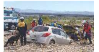
防災総合訓練の実施