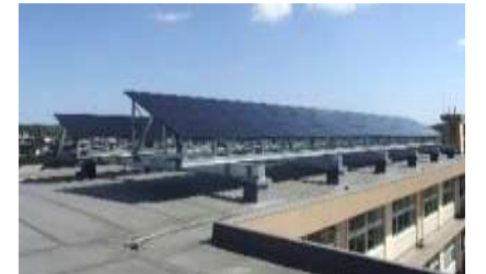
公共施設の屋上に設置した太陽光発電施設