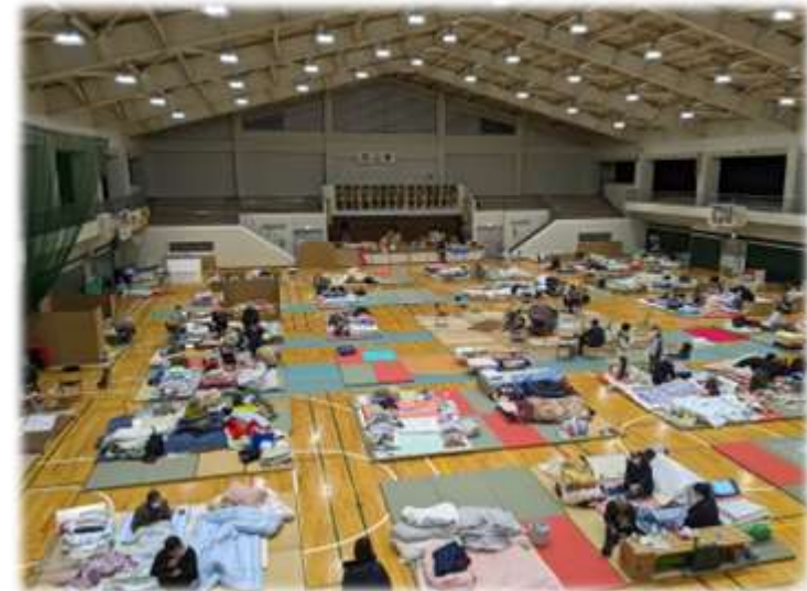
避難所の様子（1月8日 七尾市内）