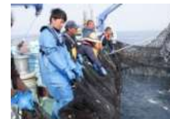
新規就業者のスキルアップ講習