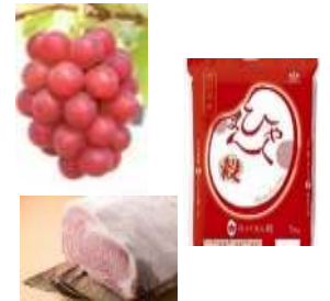
特色ある農林水産物