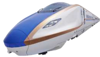
北陸新幹線など交流基盤