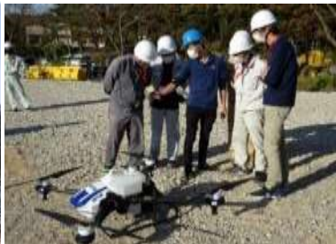
スマート農業の普及に向けたドローン操作研修