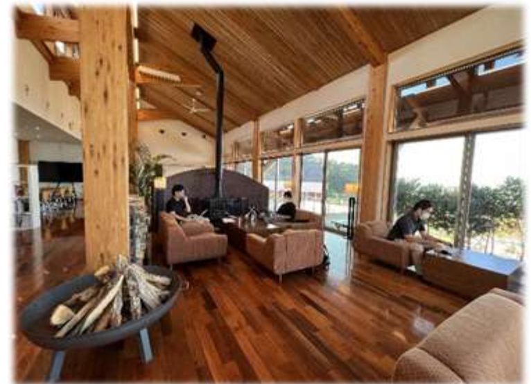
木浦ビレッジの coworking スペース

このほか、金沢・能登間の移動高速化に向けたのと里山海道の4車線化整備の促進、能登の海岸線の眺望を生かした「 能登半島絶景街道 」構想を推進します。