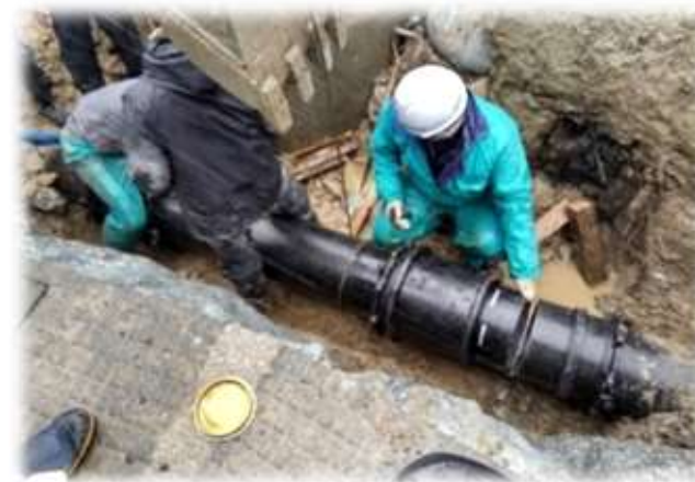
水道管の復旧作業状況（輪島市）

今回の震災ではインフラが大規模、広範囲に損傷しました。復興に向けた道のりには時間を要するなか、 県成長戦略の目標年次である令和14年度末を計画期間 とした上で取り組みを進めます。各施策については、復興タイムラインを設定し「いつ頃までに何がどうなるのか」を示し、目安をもって将来の能登の姿をイメージできるように、短期、中期、長期に分け、復興に取り組めます。