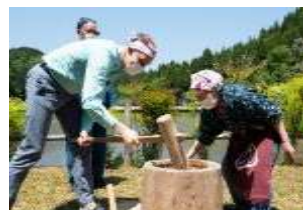
特別感のある観光コンテンツ (地元の人との餅つき体験)