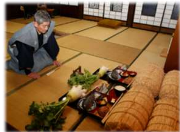
農耕儀礼 あえのこと (ユネスコ無形文化遺産)