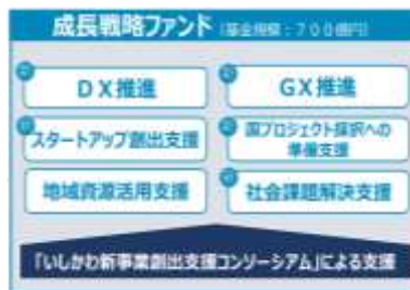
新事業・新産業の創出に向けた支援