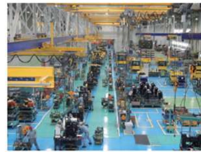
ものづくり産業の集積