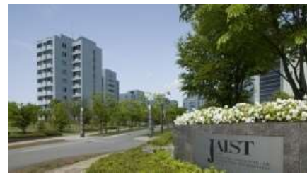
高等教育機関の集積