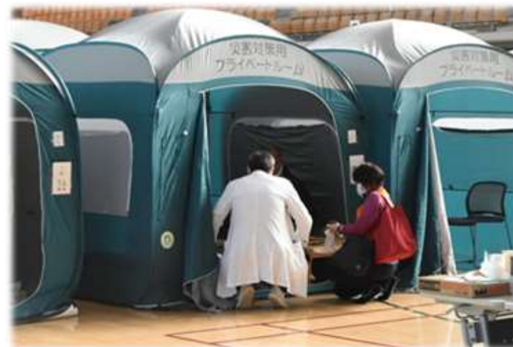
1.5次避難所の医療サービスの様子 (いしかわ総合スポーツセンター)