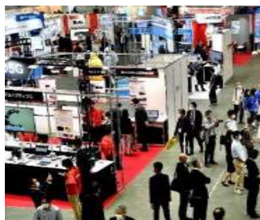
販路開拓に向けた商談会の開催