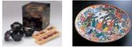
質の高い文化資源