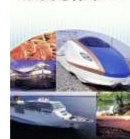
石川版教科書「ふるさと石川」