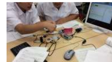
プログラミング言語を活用した電子工作