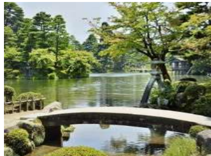
魅力ある観光資源