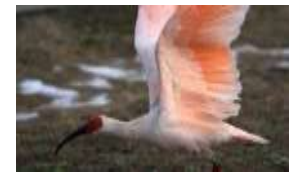
佐渡から県内に飛来した野生のトキ -6-