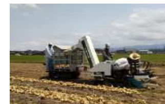
収穫機によるたまねぎの収穫