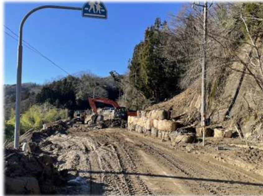
県道の復旧作業状況（輪島市内）

また、情報通信インフラの充実のほか、 液状化対策 、 住宅の耐震化 など災害に強いまちづくりを進めます。