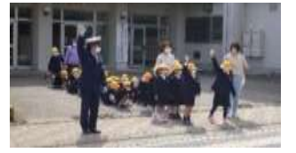
学校と連携した児童を守る交通安全運動