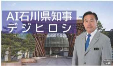
生成AIを活用した広報