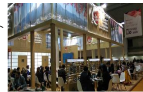
海外での旅行博覧会への出展