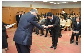
いしかわ中小企業チャレンジ支援ファンド交付式