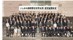
「いしかわ健康経営宣言企業」の認定