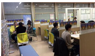
いしかわ就職・定住総合サポートセンター(ILAC)