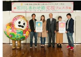
「石川しあわせ婚応援パスポート」