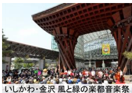
いしかわ・金沢 風と緑の楽都音楽祭