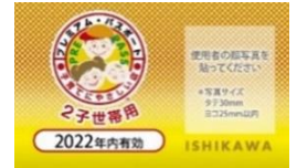
2子世帯用プレミアム・パスポート