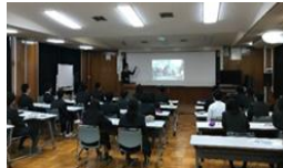
介護・福祉の仕事の魅力伝道師