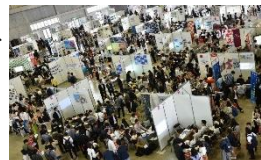
インターンシップマッチング交流会