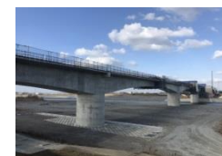
北陸新幹線(手取川橋りょう)