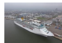
クルーズ船の定着促進