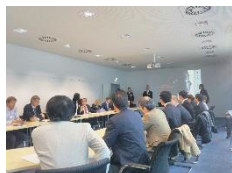
ドイツ・CFKハレーとの技術交流会

ドイツ・CFKハレーと金沢工業大学ICC等との技術交流会の実施 東海・北陸の研究機関等が連携したコンベンションの開催