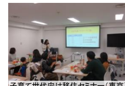
子育て世代向け移住セミナー(東京)