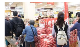
ひやくまん穀の市場デビュー