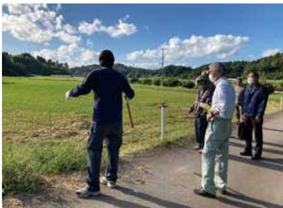
専門家による防護柵設置の現地指導

市町やJAなどで構成する鳥獣被害防止対策協議会が実施する防護柵や捕獲檻の設置、専門家の派遣などを行い、鳥獣被害の防止に取り組むとともに、捕獲した鳥獣を地域資源(ジビエ等)として利用することで、農山村地域の所得向上も期待できます。