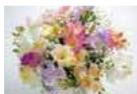
エアリーフローラ