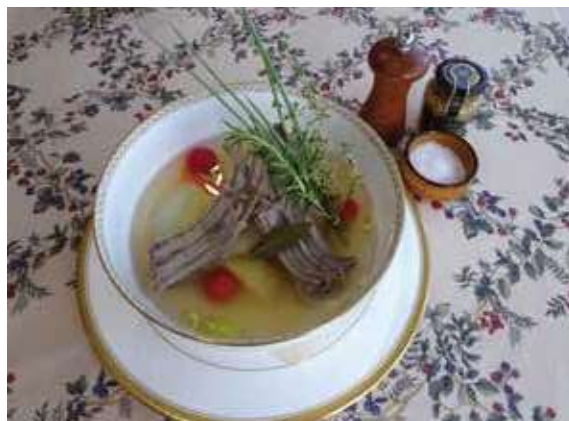
イノシシ肉のポトフ