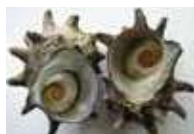
輪島海女採り さざえ