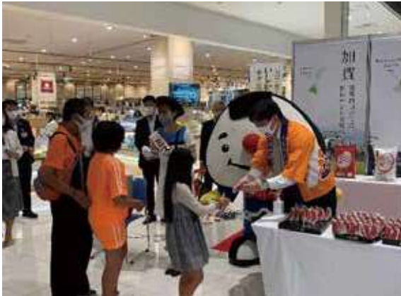
県内商業施設での新米フェア

J Aグループ等と連携して、県内外において石川県産米の販売促進キャンペーンを実施し、県産米の消費拡大に取り組んでいます。