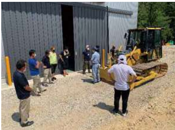
農業用ブルドーザ研修

ICT機能を持つ農業用ブルドーザによる農地の均平化やドローンによる病害虫防除・播種・施肥など、スマート農業の技術開発、現地実証、技術の普及に取り組んでいます。