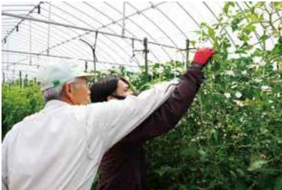
ミニトマト栽培の研修

新規就農者への実践的なトレーニングをはじめ、農業経営者が経営感覚を磨く研修、消費者の農業体験など、様々なカリキュラムを行っています。