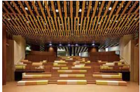
床材や天井材、書架などに県産材を使用した県立図書館