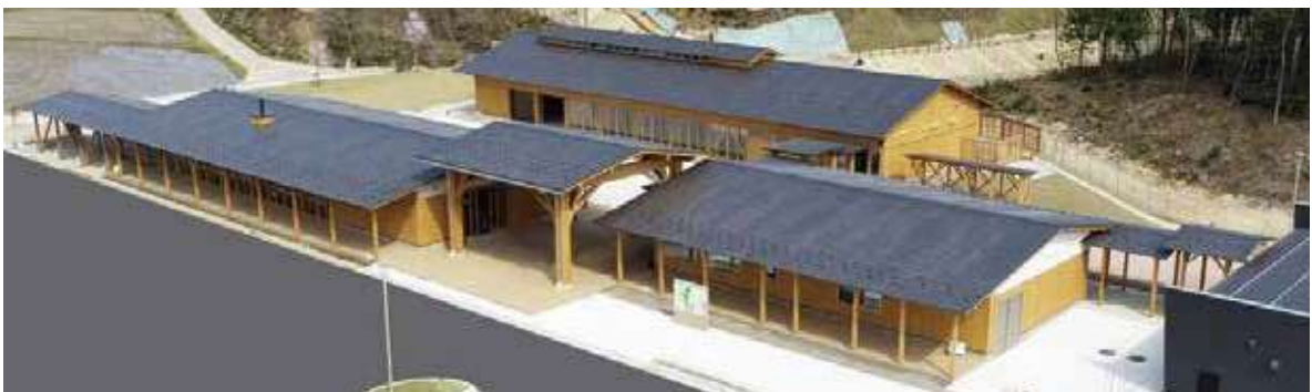
CLTを活用した里山交流ハウス（木場潟公園東園地）

「Cross Laminated Timber」の略で、一定の寸法に加工されたひき板（ラミナ）を繊維方向が直交するように積み重ねて接着した木質系材料です。建築物を支える柱としての強度を有するとともに木材としての断熱性を有しており、住宅のほかに中高層建築物などに利用されるようになってきています。