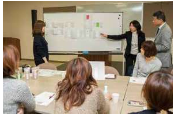
女性農業者の経営管理能力向上研修