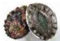
輪島海女採り あわび