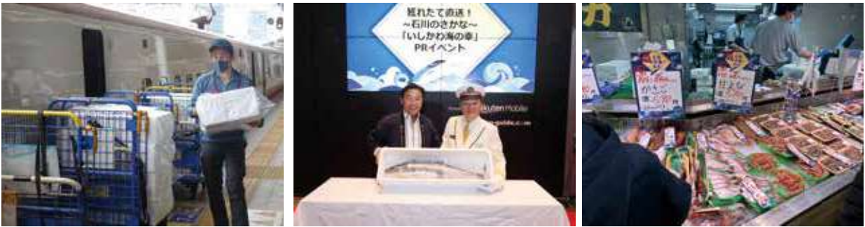
北陸新幹線を活用した朝どれ水産物の首都圏での販売

北陸新幹線を使った物流サービスを活用し、首都圏の一般消費者や事業者へ水揚げされる水産物の魅力を発信し、県産水産物の販路拡大や石川県へのさらなる観光客誘致につなげます。