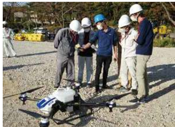
ドローン操作研修