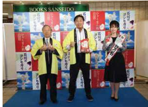
首都圏でのひやくまん穀など県産米の販売促進