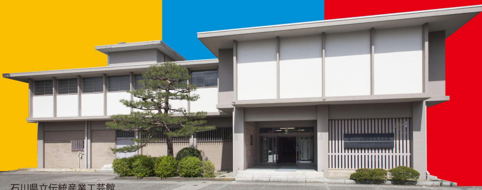
石川県立伝統産業工芸館

2名様 商品券 5千円分及び 1年間無料パス2名様分 ※採用者が複数名の場合、抽選します。