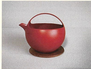
お酒を入れるとゆらゆら揺れる漆の片口 可愛い見た目でも、注ぎ口の切れは抜群です