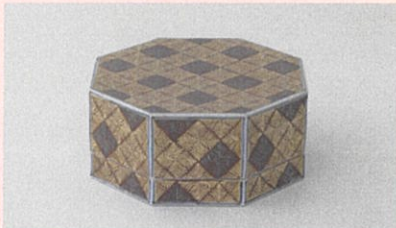
富本嘉吉《色絵金銀彩羊歯文八角飾箱》 1959年 東京国立近代美術館蔵

東京国立近代美術館工芸館は、通称・国立工芸館として2020年10月25日、石川県金沢市に移転開館します。移転開館の第一幕を飾る本展で