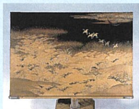
重文《詩絵和歌の浦図見台》伝 清水九兵衛

室町時代の作刀を軸とした諸工芸の連携は、文化力で江戸幕府に対抗した加賀藩主・前田家の工芸振興へと拡充されました。本展は、加州刀、古九