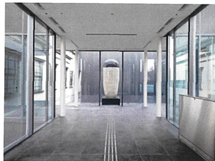
エントランス風景

皇居のほりから、工芸のまちのなかへ。 近・現代工芸の多種多様なコレクションをもつ「国立工芸館」が、藩政期以降現代までの歴史的建造物・文化施設が集まるエリアで、工芸文化の発信拠点として新たなスタートをきります。