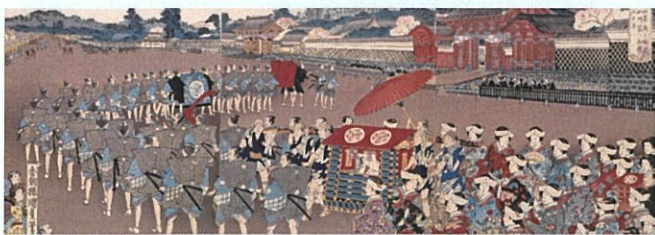
「松乃栄」 東京大学総合図書館蔵

江戸に諸大名の屋敷が整備された江戸時代、加賀藩は「赤門」で知られる本郷の屋敷が長く拠点として機能しました。ここで行われた大名行事に迫