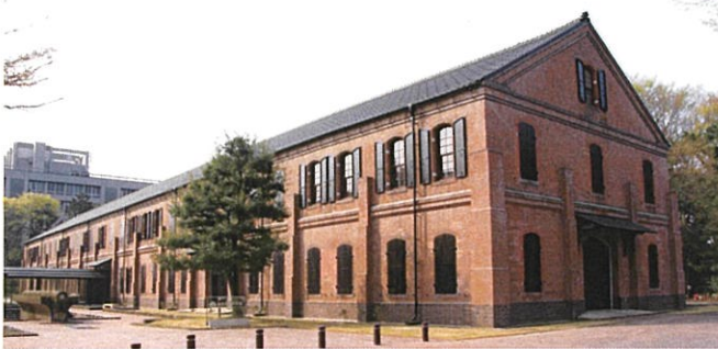
いしかわ赤レンガミュージアム