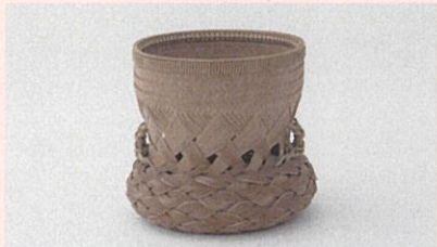
飯塚環珣斎《花籃 あんころ》 1957年 東京国立近代美術館蔵