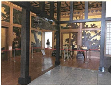
高岡市に移築された松楓の間