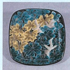
二代浅蔵五十吉《樹間に遊ぶ 色絵飾皿》

石川県には受け継がれてきた工芸の土壌と、そこに深く根付いた文化があります。この地で作り続けられてきた工芸、そして文化の灯を絶やさない。