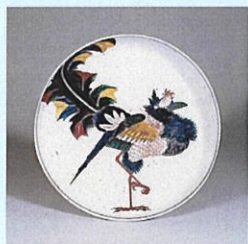
石川県指定文化財《色絵鳳凰図平鉢》 古九谷