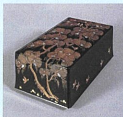
松田権六《松蔭絵飾箱》