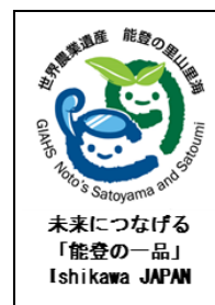
「能登の一品」の ロゴマーク