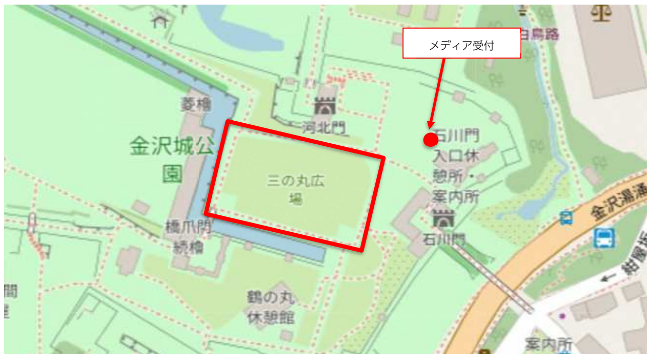
@OpenStreetMap (and) contributors, CC-BY-SA