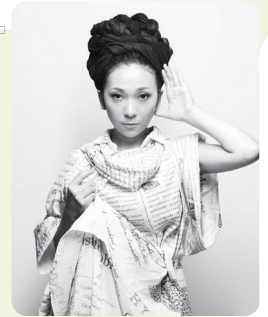
MISIA (アーティスト) mudef Ambassadorとして 「MISIAの森」プロジェクトを実施

Facebook、Instagram上で「いいね」の数が多い上位3作品 …… 3点