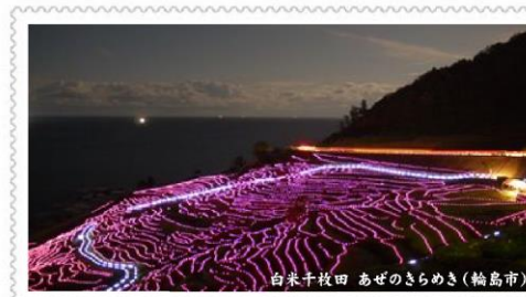
白米千枚田 あぜのきらめき(輪島市)