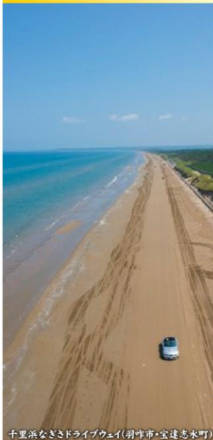
千里浜なぎさドライブウェイ(羽咋市・宝達志水町)