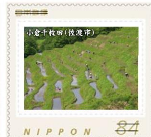
小倉千枚田(佐渡市)