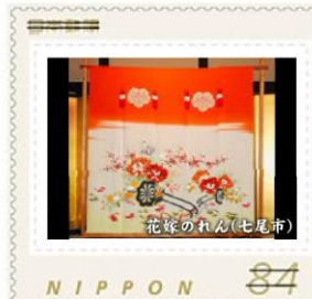
花嫁のれん(七尾市)