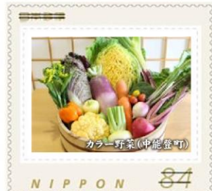
カラー野菜(中能登町)