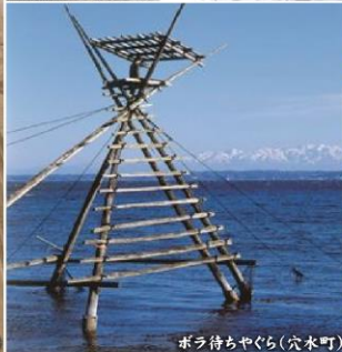
ボラ待ちやぐら(穴水町)