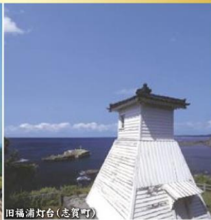
旧福浦灯台(志賀町)