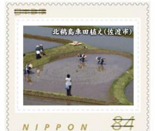
北鶴島車田植え(佐渡市)