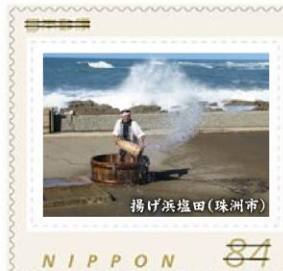
揚げ浜塩田(珠洲市)