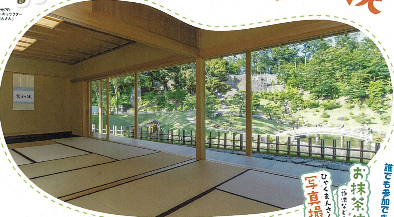
石川県観光PR マスコットキャラクター 「ひやくまんさん」