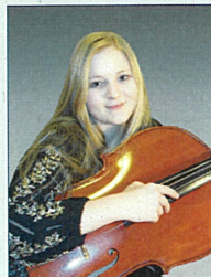
チェロ ヤーナ・ラヴロワ