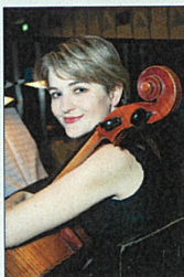
チェロ タチアナ・ラヴロワ