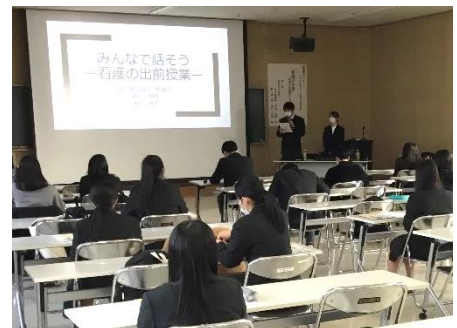
写真はいずれも 地域の看護職による講義の様子