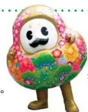
石川県観光PR マスコットキャラクター ひやくまんさん