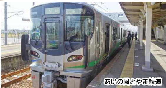
あいの風とやま鉄道