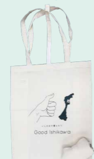
オリジナルトートバッグ