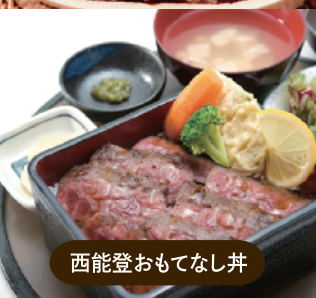
西能登おもてなし井