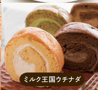
ミルク王国ウチナダ