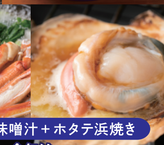
紅ズワイの味噌汁+ホタテ浜焼き