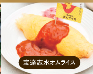
宝達志水オムライス