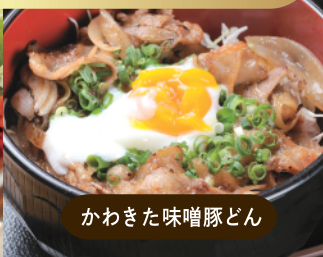
かわきた味噌豚どん