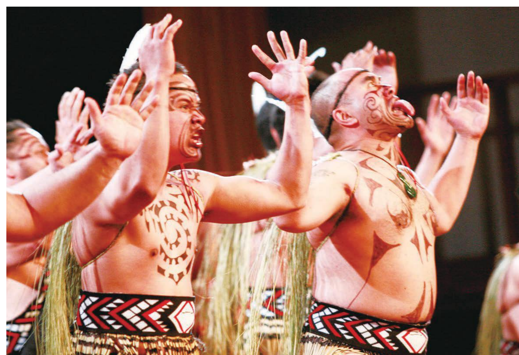
民族舞踊「ハカ」。マオリの人々の伝統的な踊りで、戦場で敵と対面するときや和平を結ぶ際に、一族のプライドをかけて披露する慣わしがありました。