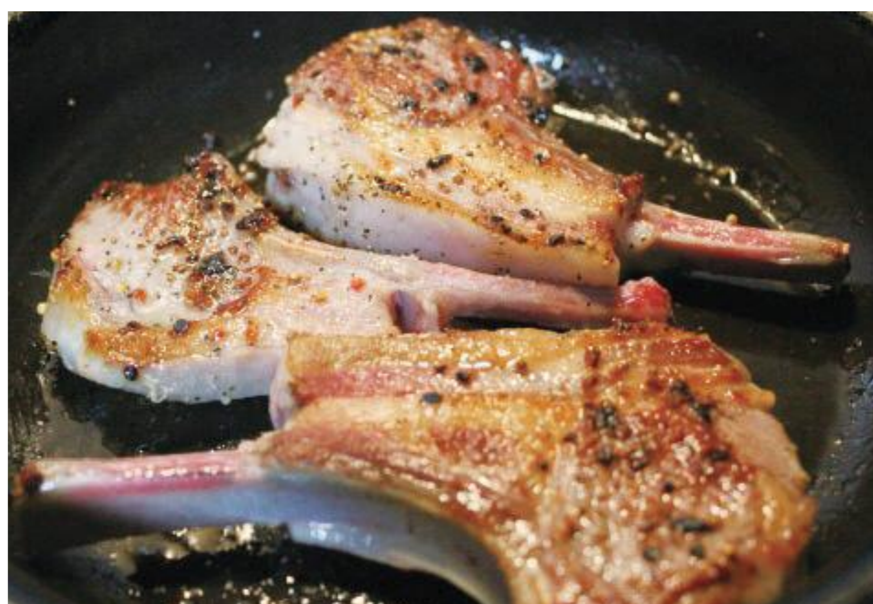
「ラムチョップ」は、生後1年未満のラム肉を使った骨付きあばら肉です。グリルして食べるのが一般的で、羊肉特有の臭みもなく柔らかでジューシーです。