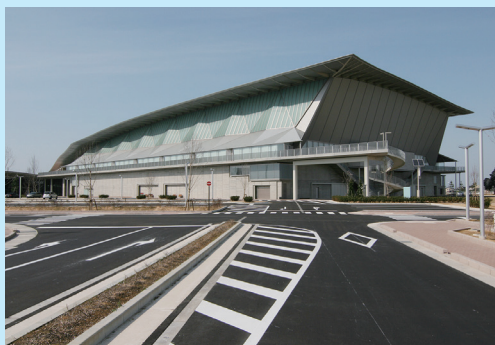
▲いしかわ総合スポーツセンター

JR金沢駅より北鉄バス「袋畠西部緑地公園前」下車徒歩5分 JR金沢駅より北鉄バス「西部緑地公園」下車