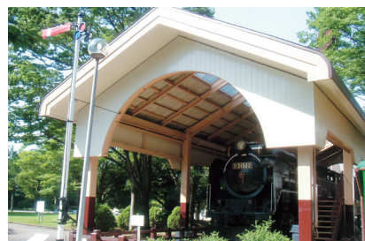
▲中央広場(蒸気機関車の展示)