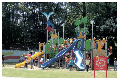
▲中央広場(大型遊具)