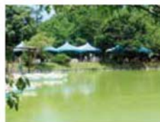
▲大池とバーベキュー場