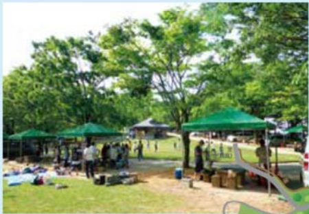
▲デイキャンプ広場