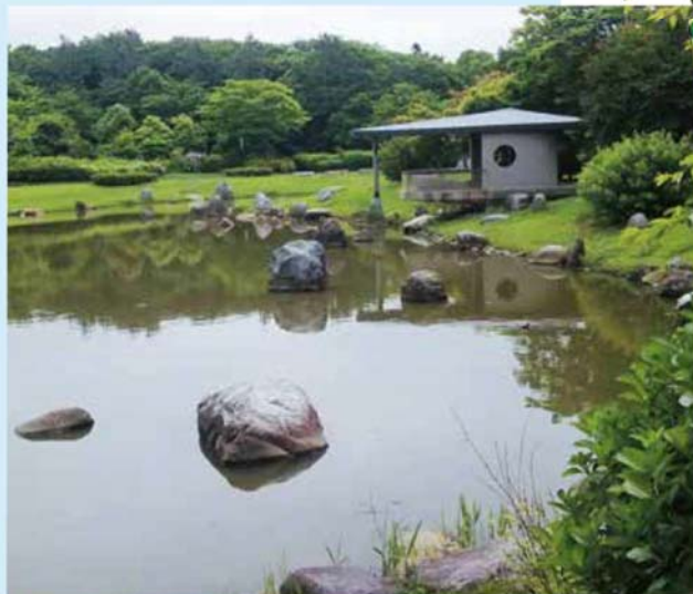
▲池と舟を模した休憩所