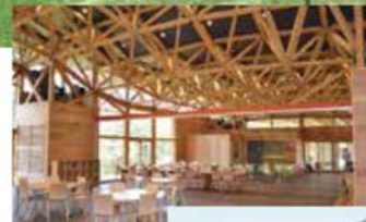
▲とんぼテラス 内部