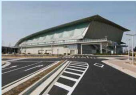
▲いしかわ総合スポーツセンター

JR金沢駅より北鉄バス「袋島西部緑地公園前」下車徒歩5分 JR金沢駅より北鉄バス「西部緑地公園」下車