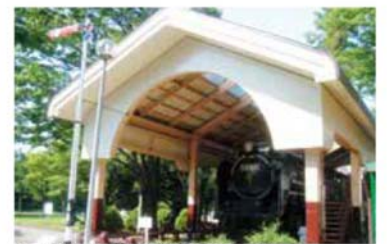
▲中央広場(蒸気機関車の展示)