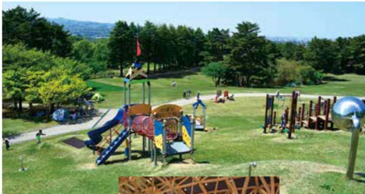
▲こどもひろば(大型遊具)

平成30年には新たな公園センターである「奥卯辰山のびのび交流館とんぼテラス」がオープンし、遊びや休憩、レクリエーション活動など、休日には多くの家族連れで賑わっています。