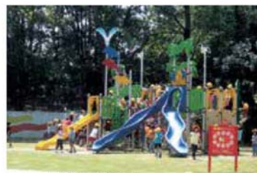
▲中央広場(大型遊具)