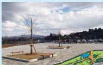
◀法島地区 エントランス