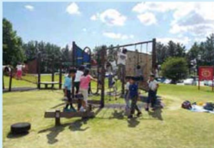
▲ちびっこ広場(大型遊具)