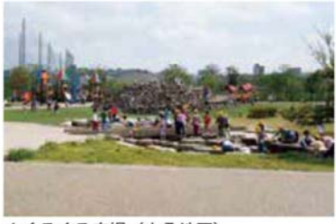
▲ぐるぐる広場(大桑地区)