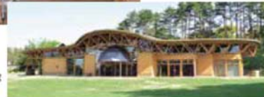
▲奥卯辰山のびのび 交流館とんぼテラス