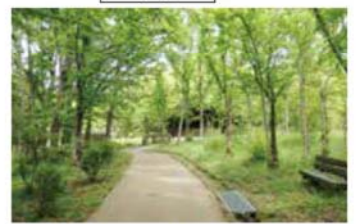
▲どんぐりハウス周辺