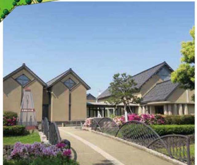
▲銭屋五兵衛記念館