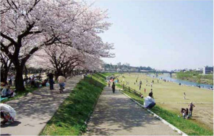
▲上菊橋上流(法島地区)

ここ犀川緑地は、春には花見、夏には釣りや花火大会など、秋には運動会、グラウンドゴルフ大会、冬にはソリ遊びにと四季折々の水辺レクリエーションの場として親しまれています。