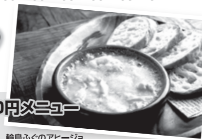
輪島ふぐのアヒージョ

5年連続日本一の漁獲量を記録した天然ふぐ「輪島ふぐ」を使った、多彩なメニューを提供!