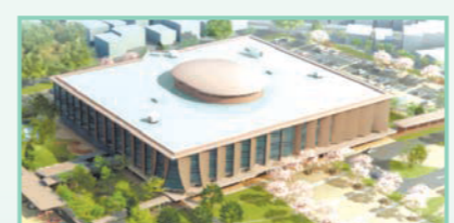
新県立図書館(イメージ)