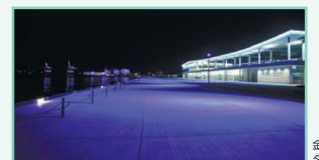
金沢港クルーズターミナル