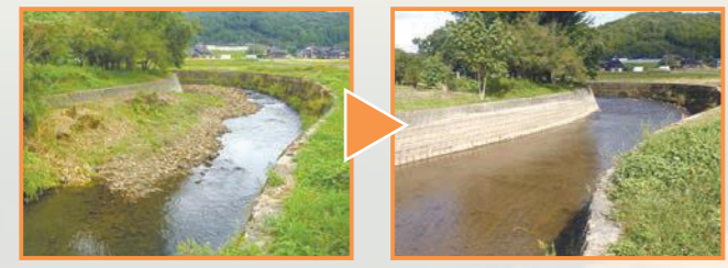
熊木川(堆積土砂除去前) 熊木川(堆積土砂除去後)