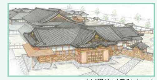
二の丸御殿(表向主要部のイメージ)