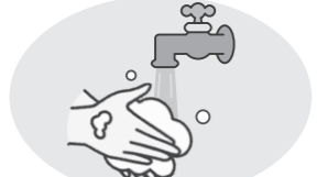
手指の消毒・手洗い