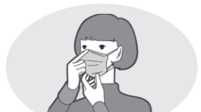
混雑した場所や会話の場面でのマスク着用