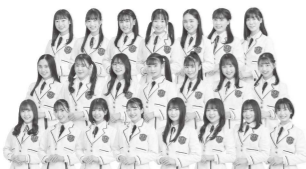
ほくりくアイドル部