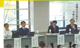
夜間中学シンポジウム

県立金沢中央高等学校内に令和7年4月に開校することとし、校名を「石川県立あすなろ中学校」に決定しました。