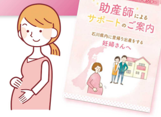
産科などで配布しているリーフレット

県外から里帰り出産のために帰省された妊婦に対し、助産師による個別訪問や相談などの支援を行う全国初の取り組みを開始しました。