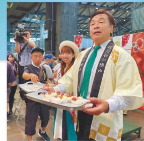
東京でのトップセールス

ルビーロマンや、加賀しずく、能登牛などの認知度向上と販路拡大につなげるため、首都圏や県内でPRイベントを開催しました。