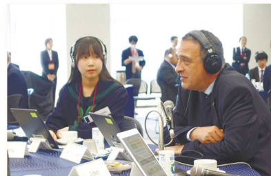
出席者と学生とのグループディスカッション

子どもたちのウェルビーイングの向上などを旨とする「富山・金沢宣言」が採択されました。さらなる国際会議の誘致に取り組み、本県の魅力を発信していきます。