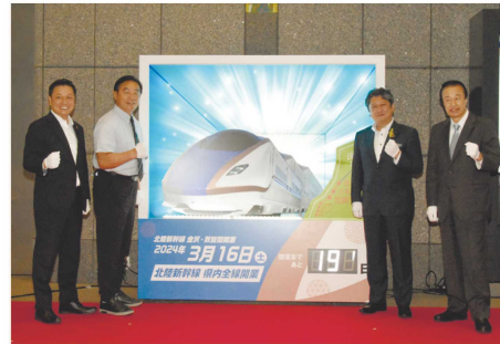
カウントダウンボード除幕式

開業日が決定しました。県ではカウントダウンボードの設置や、車両歓迎セレモニーの開催など機運の醸成とともに、三大都市圏への情報発信の強化などにも取り組んでいます。