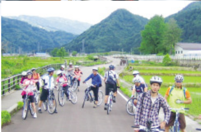
▶加賀から能登まで自転車で行った台湾からのサイクリングツアー(6月)の様子

開くなど海外誘客促進に取り組みました。さらに、この機会を利用して南京と台湾で県独自のトップセールスを展開し、観光PRに努めました。また、アジアや欧米から海外メディアを招き、石川県の安全性や観光地の魅力をアピールしていきます。