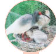
生後31日、33日目 (6月3日撮影)