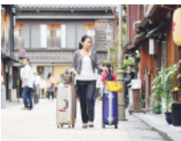
ひがし茶屋街で撮影した『花嫁のれん』のワンシーン

ご主人が体調を崩した私のためにおかゆを用意してくれたりしました。石川県の方は一見シャイなのですが、心を開くと本当に優しい方ばかり。宿泊先の金沢や和倉温泉の女将さんからも、接客時の心構えなどの貴重なお話をうかがい、役作りをする上で大変参考になりました。ほかに、加賀友禅や九谷焼といった伝統工芸、情緒ある茶屋街、活気あふれる近江町市場など、石川県は数え上げたら切りがないほどの魅力があり、旅好きの私の中でもお気に入りの場所の一つです。平成26年度には北陸