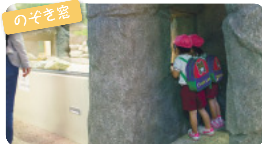
さまざまな視点から観察できるようなぞき窓を設置