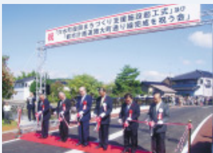
▲穴水駅と商店街を結ぶ復興シンボルロード「都市計画道路大町通り線」の開通式

穴水町では、昨年10月に復興のシンボルロードとなる「都市計画道路大町通り線」が完成しました。これにより中心商店街と穴水駅が結ばれ、伝統的な黒瓦屋根と下見板張りの家が立ち並ぶ町並みの再生を後押しし、にぎわい創出につながるものと期待されます。輪島市でも、道路の拡幅に合わせて無電柱化を推進するなど、災害に強いまちづくりが進められています。