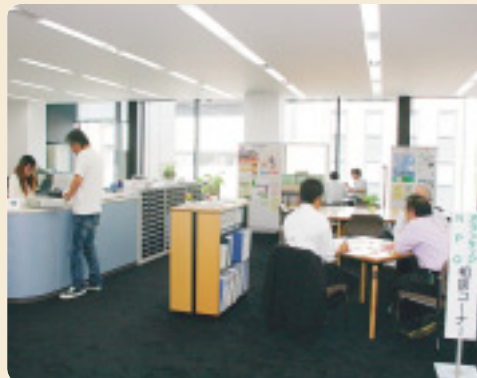
県内のNPO・ボランティア団体が訪れる「あいむ」。土・日曜も開館しています

●問い合わせ 県NPO活動支援センター「あいむ」 金沢市香林坊2丁目4番30号 香林坊ラモーダ7階 TEL 076 (223) 9558 / FAX 076 (223) 9559 ホームページ www.ishikawa-npo.jp Eメール npo@pref.ishikawa.lg.jp 開館時間 午前9:00～午後9:00(土・日曜は～午後5:00まで) 休館日 月曜、祝日、年末年始 ※駐車場は香林坊地下駐車場をご利用ください。1時間の割引サービス券を交付します。