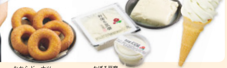
おからドーナツ 5個入り400円、1個100円 おぼろ豆腐 1丁350円、カップ200円 豆乳ソフトクリーム 300円