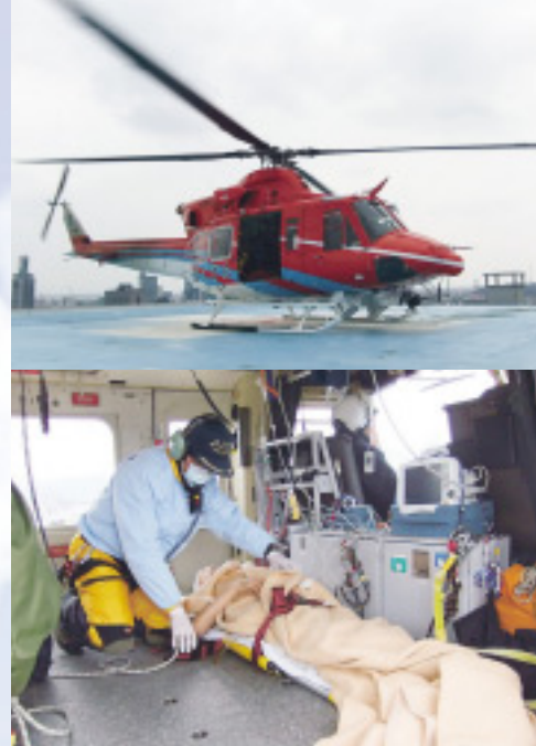
▲地震発生当初、県防災ヘリも被災地で救命活動を行いました

3月11日に発生した東日本大震災から4カ月がたちました。日本の観測史上最大となるマグニチュード9.0と、大津波がもたらした未曾有の大災害は、今もなお岩手県、宮城県、福島県など東北地方を中心に深い傷跡を残しています。石川県では、被災者や影響を受けた県内企業などの支援を急ぐとともに、大震災を教訓に、より安全・安心な暮らしを実現するための防災体制の確立に取り組んでいます。