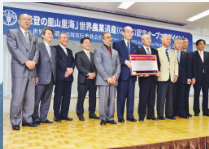
▲認定を受け、6月17日に「能登の里山里海」世界農業遺産認定オープニングイベントを開催。同日、「世界農業遺産活用実行委員会」を設立しました

6月11日、「能登の里山里海(羽咋市以北4市4町)」が、「トキと共生する佐渡の里山(佐渡市)」とともに、国連食糧農業機関 (FAO) により、国内だけでなく、先進国としても初めて世界農業遺産 (GIAHS) に認定されました。今回の認定は、農林水産業や暮らしの中で育まれてきた能登の自然、文化、景観などが、次の世代に引き継ぐべき素晴らしい財産として、世界的に高く評価されたものです。