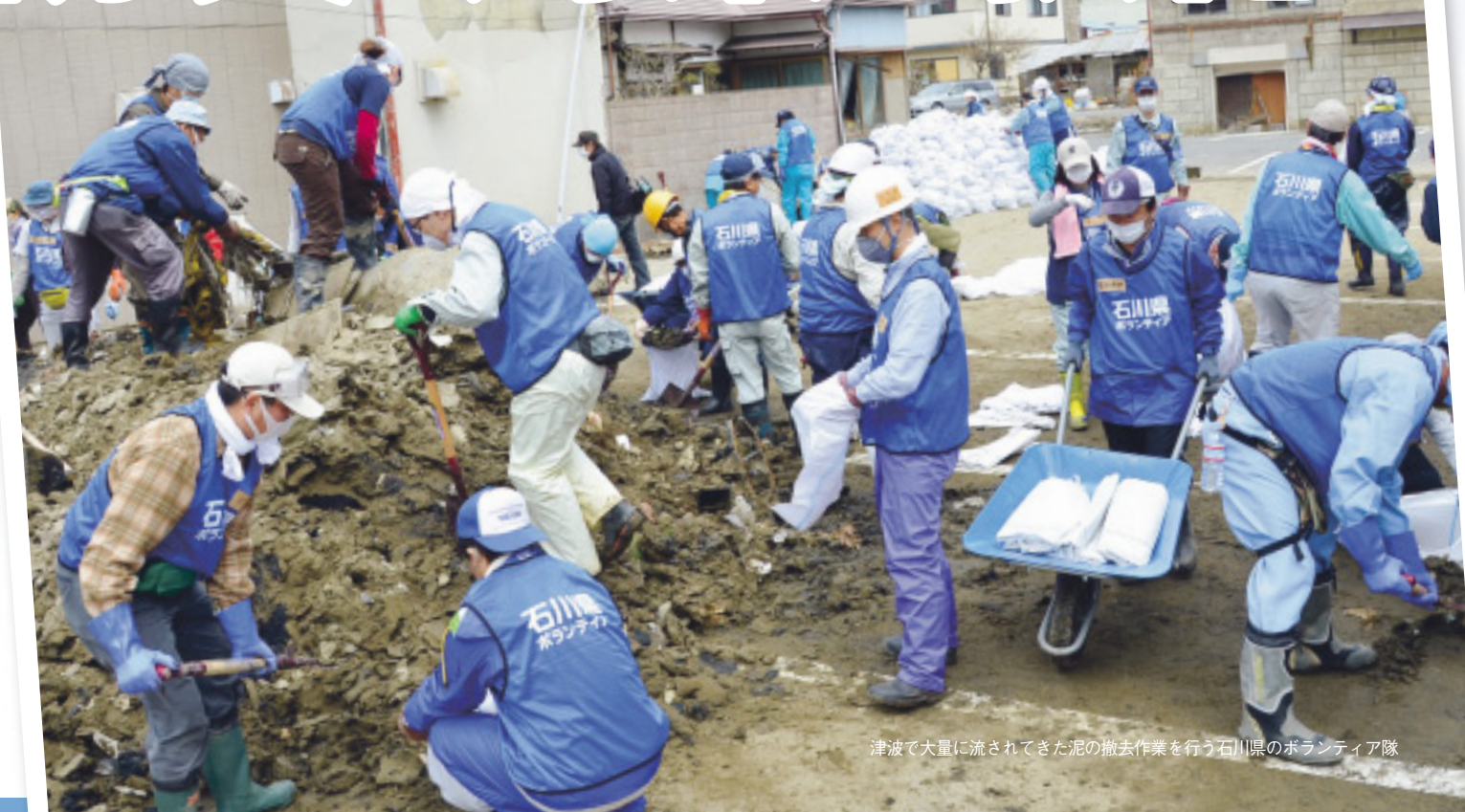
津波で大量に流されてきた泥の撤去作業を行う石川県のボランティア隊

地震から2カ月後に被災地に入ったのですが、崩れた住宅や横になった車など、今も残る震災のつめ跡に驚きました。そんな中であっても、出会った被災者の皆さんからは、「ご苦労さま」と声をかけていただきました。ボランティアに取り組む上で、とてもうれしかったですし、励みになりましたね。