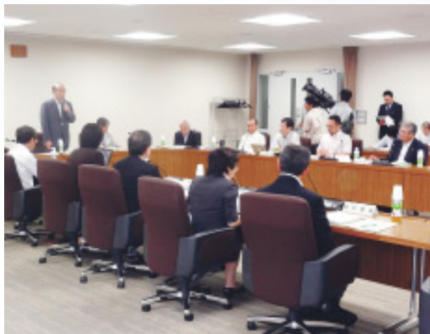
◀7月4日、地域防災計画(震災対策編)の見直しに向け、第1回震災対策部会を開催しました