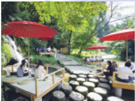
▲メルマガジンでは温泉地(写真)などにスポットを当てた情報を配信

さらに、県内での勤務経験のある国際交流員や県と関係の深い外国人などを海外版いしかわ観光特使に任命し、口コミの力を生かした誘客策にも力を注ぎ、海外誘客の回復や一層の掘り起こしに結び付けていきます。