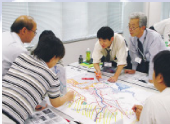
▲防災士の養成講座では、グループワークなど実践的な学びを展開