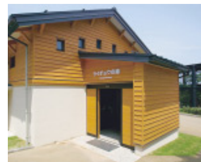
楽しくライチョウの生態を学べます

導きます。真夏でも20度以下に保たれた館内は、ひんやりとした空気に包まれ、ハイマツなどの高山植物を見ることができま。