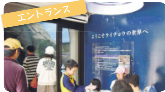
館内に入ると、頭上から雪!子どもたちの人気を集めています