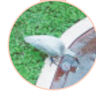
巣立ちしたヒナ (6月5日撮影)

4月～5月にかけて、いしかわ動物園で分散飼育に取り組む国の特別天然記念物トキのつがい2組から計9羽のヒナが生まれました。分散飼育がスタートした昨年に続いてヒナが誕生したことになり、さらに、今年からは親鳥のもとで育てる「自然育すう」の取り組みも始まりしました。4羽(つがい2組に2羽ずつ)を巣に戻したところ、ヒナをかいかいしく世話する親鳥の姿が見られ、6月には無事、巣立ちを迎えました。自然育すうで成長したトキは放鳥後、つがいとなる可能性が高いと言われています。