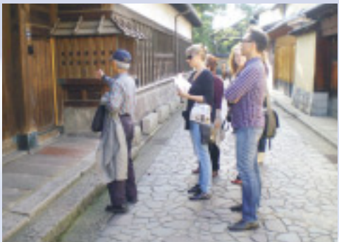
▲海外メディアを招き、県内観光地の魅力をアピール

東日本大震災の影響は、石川県内のさまざまな産業にも及んでいます。特に、海外からの観光客については、来県者数の目安となる兼六園への外国人入り込み客数が今年4月、