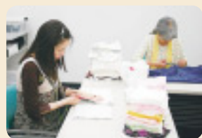
軽作業も行えます

福祉や環境、文化、教育、国際協力など、県内では、多くのNPO・ボランティア団体がさまざまな活動に取り組んでいます。そんな皆さんのサポートを目的に、県では、県NPO活動支援センター「あいむ」を設置しています。