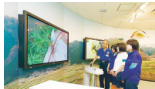
▲大型パネルを設置したトキ展示・映像コーナー

分散飼育中のトキは、動物園の動物学習センター内にあるトキ展示・映像コーナーで見られます。すくすく元気に成長中のヒナたちの姿を、ぜひご覧ください。