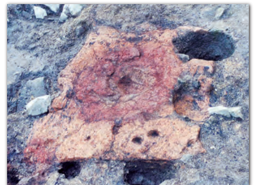
上絵窯の跡(加賀市九谷A遺跡)