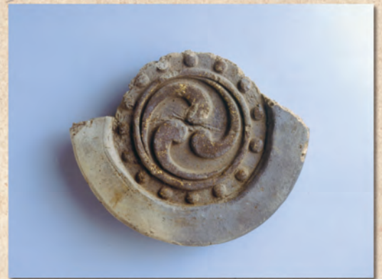
きんぱくがわら 金箔瓦 (金沢市前田氏(長種系)屋敷跡)