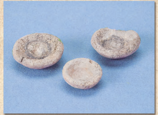
るつぼ 金を溶かした埴塼 (七尾市七尾城跡)

現代の暮らしに生きる伝統的な工芸品や、それを生み出す技術は、長い歴史の中で育まれてきた人間の知恵の結晶です。 今回の展示では、「漆製品」「陶磁器」「金工品」の3分野をとりあげ、伝統工芸としての価値が確立する以前からの技術と歴史をご紹介します。ものづくりの技や技術革新が、伝統を生み出していく様子を、縄文時代から近世に至る出土品から探ります。