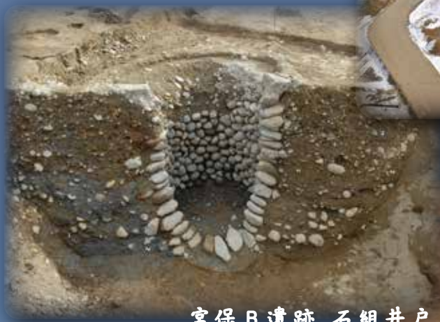
宮保B遺跡 石組井戸