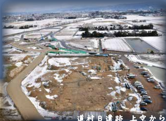
道村B遺跡 上空から