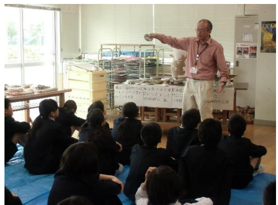
白山市蝶屋小学校（H26. 5、白山市参加）