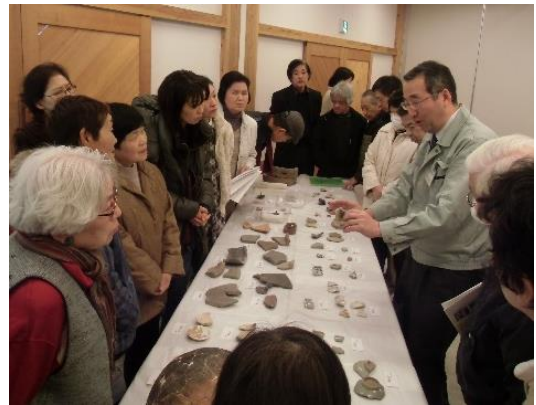
白山市一ノ宮公民館（H26. 2）