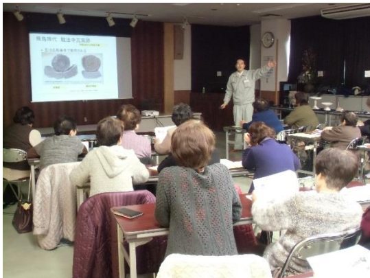
金沢市森本公民館（H26. 2）

「ふるさと遺跡塾」の開催 期間：1/5（月）～2/27（金）（平日） 受付：10/6（月）～