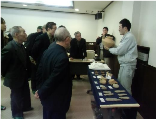
能登町柳田公民館（H26. 1）

公民館や集会所などへ職員がでかけ、身近な遺跡と出土品の展示・解説をおこなう学習教室。公民館の生涯学習、町会の地域学習として利用可能。