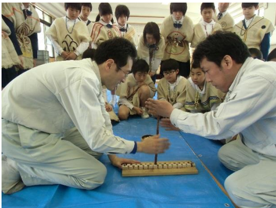
津幡町英田小学校（H26. 4、津幡町参加）

学校などへ職員がでかけ、「縄文人の暮らし」や「弥生人のワザ」にふれる体験教室を開催。センターが体験用具を運び込み、市町が地元の出土品展示なども実施。