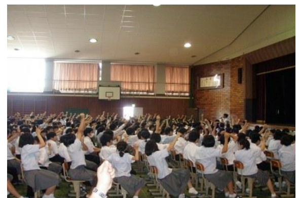
平成27年6月29日 加賀市立山代中学校