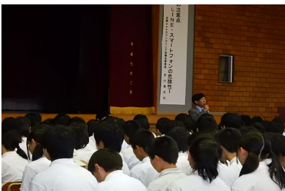
平成27年6月10日 加賀市立錦城中学校