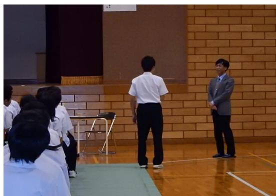
平成27年6月10日 加賀市立山中中学校