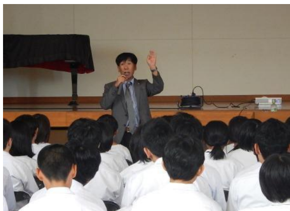
平成27年6月30日 加賀市立橋立中学校