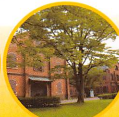
石川県立歴史博物館