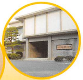
いしかわ生活工芸ミュージアム (石川県立伝統産業工芸館)