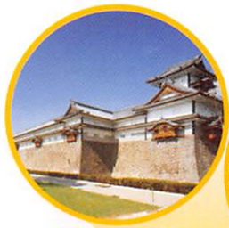
金沢城公園 菱櫓・五十間長屋・ 橋爪門続櫓・橋爪門