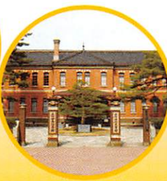
石川四高記念文化交流館 (石川近代文学館)