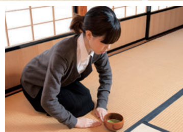
②亭主にあいさつをします。茶碗は自分の正面に

茶碗が自分の前に置かれたら一礼します。まず、上座の人との間に茶碗を置き「お相伴させていただきます」、次に下座の人との間に茶碗を置き「お先に頂戴いたします」、その後茶碗を自分の前に戻し、亭主に「お点前を頂戴いたします」とあいさつをします。右手で茶碗を左手に乗せ、茶碗を回して正面を外して数口で飲み切り、飲み口を指で拭きます。最後に、正面に戻して自分の前に置き、両手をついて茶碗を拝見します。