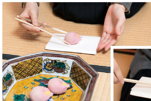
①箸を使って菓子器から懐紙の上に移します

茶会では、菓子器に盛られたお菓子を順番に受け取っていきます。その際は、自分の次に待つ客に対して「お先に」と一礼してから懐紙を取り出して膝前に置き、主菓子は箸を使って(干菓子は手で)取ります。食べる時は懐紙ごと持ち上げ、主菓子は楊枝を使って一口ずつ(干菓子は手で)いただきます。一人一皿ずつ出てくるお菓子は、そのまま一礼して受け取りましょう。