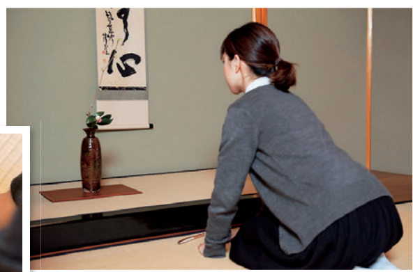
②手はついたまま、掛物、花入の順に拝見します