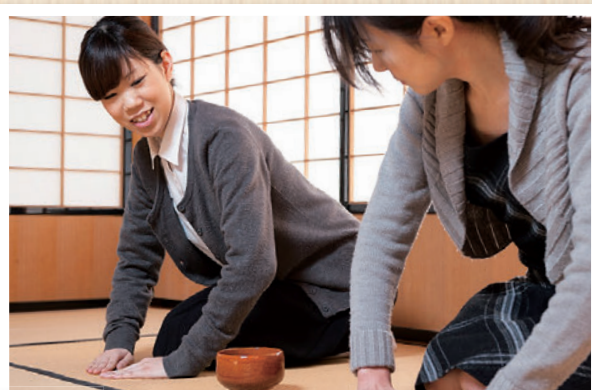
①まずは両隣の人にきちんとあいさつをしましょう