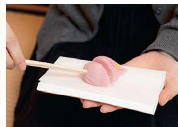
②楊枝で食べやすい大きさに切っていただきます