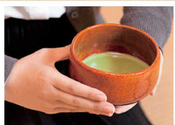
③茶碗を回して正面を外してからいただきます