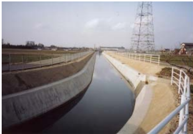
既設護岸の表面をコンクリートで被覆し、通水機能を回復。