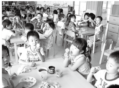
ブラックベリージャムをクラッカーにつけて食べています。