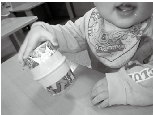
ゼリーカップでマラカスを作りました。