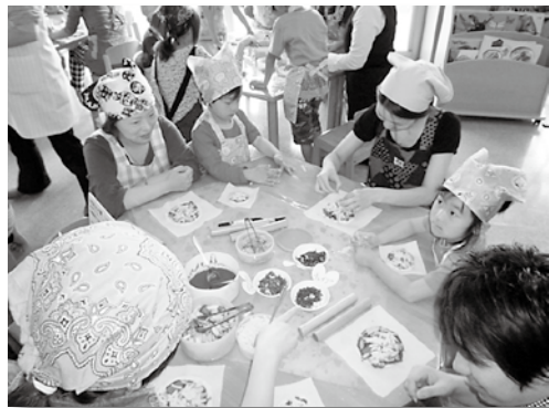
ハーブ入りピザ作り