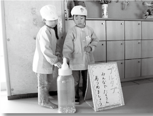
プルタブを集めて容器に入れていきます。