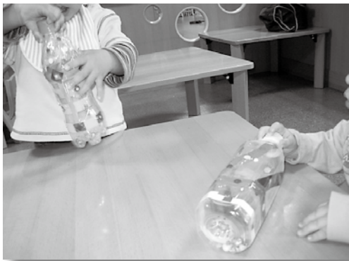
ペットボトルのマラカスを作りました。