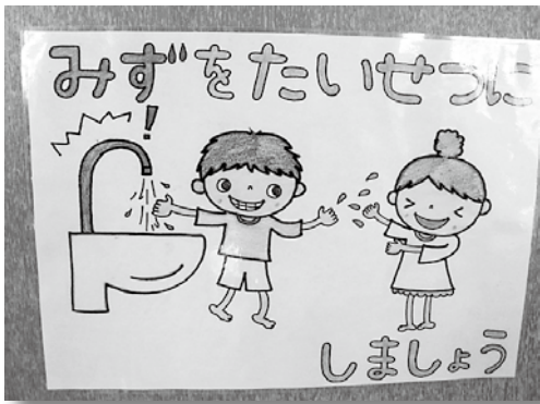
節水ポスターを作りました。