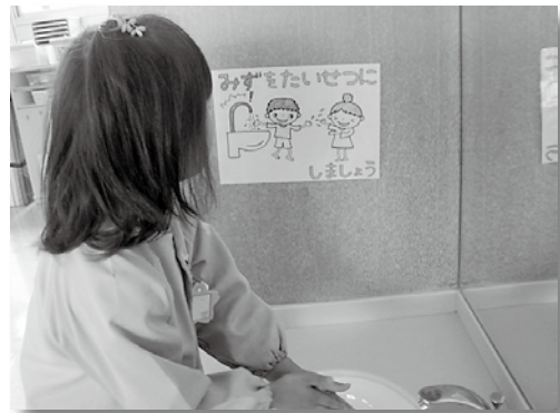
ポスターを見て心がけています。