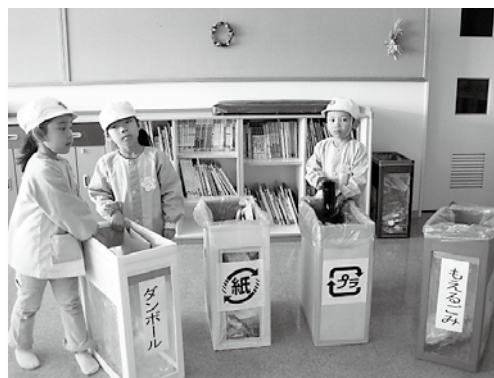
分別ゴミ箱へ考えながら捨てています。