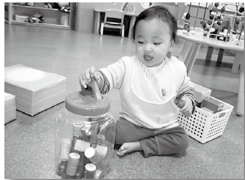
ホースで型入れ玩具を作りました。