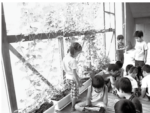
グリーンカーテンの日陰を選び遊んでいます。