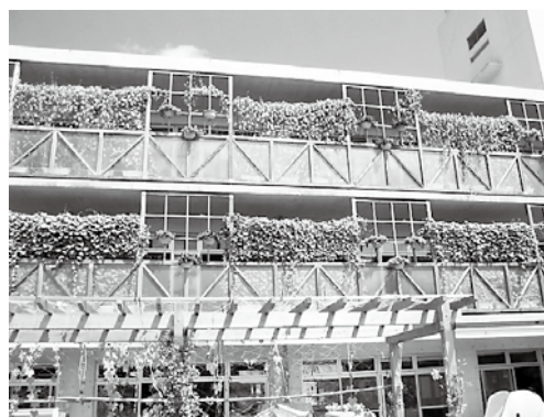
各部屋のバルコニーにグリーンカーテンができました。