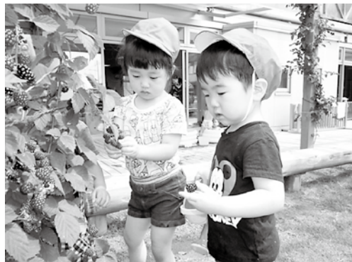
ブラックベリーの収穫をしています。