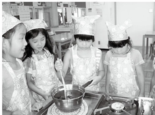
ブラックベリーのジャムを作っています。