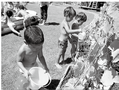
ヘチマ・ヒョウタンの水やりをしています。