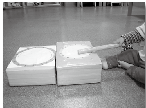
ダンボールで太鼓を作りました。