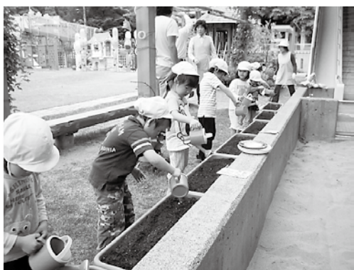
朝顔の種を植えて水やりをしています。

・ペットボトルでマラカス・ホースで輪投げや型入れ・段ボールで動く人形や的あて動物や太鼓等を作り遊びました。