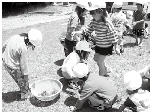
園庭の草むしりをみんなでしています。