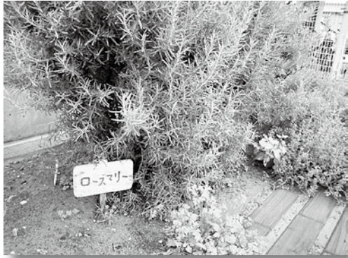
堆肥をつかってハーブづくり