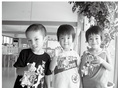
ハーブでコラージュを制作しました。